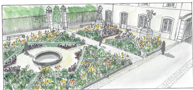
1 / Hôtel-Dieu - Hospices Civils de Beaune - Cour des Fondateurs - Jardin, Échos polychromes - Croquis d'ambiance © Stéphane Larcin • Concepteur - Paysagiste