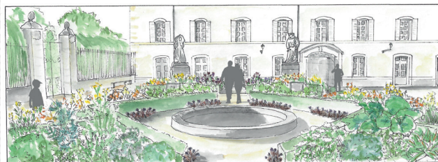
2 / Hôtel-Dieu - Hospices Civils de Beaune - Cour des Fondateurs - Jardin, Échos polychromes - Croquis d'ambiance © Stéphane Larcin • Concepteur - Paysagiste