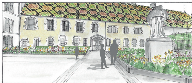
3 / Hôtel-Dieu - Hospices Civils de Beaune - Cour des Fondateurs - Jardin, Échos polychromes - Croquis d'ambiance © Stéphane Larcin • Concepteur - Paysagiste